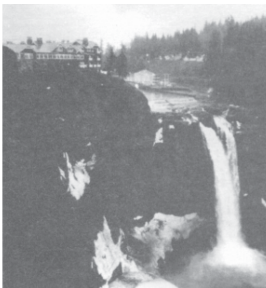
Vandfaldet, hvor The Great Northern ses i baggrunden.